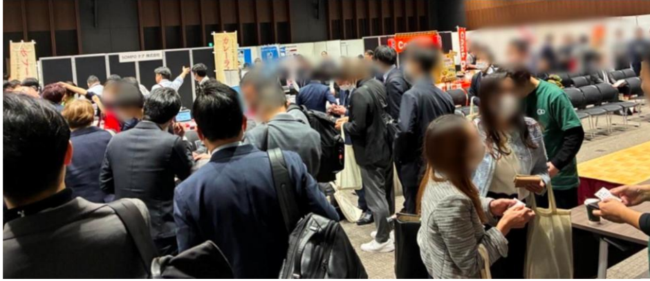
※前回の「笑美面 インパクトミーティング関東'26」では、出展ブース企業や運営事業者間の情報共有・交流が生まれた