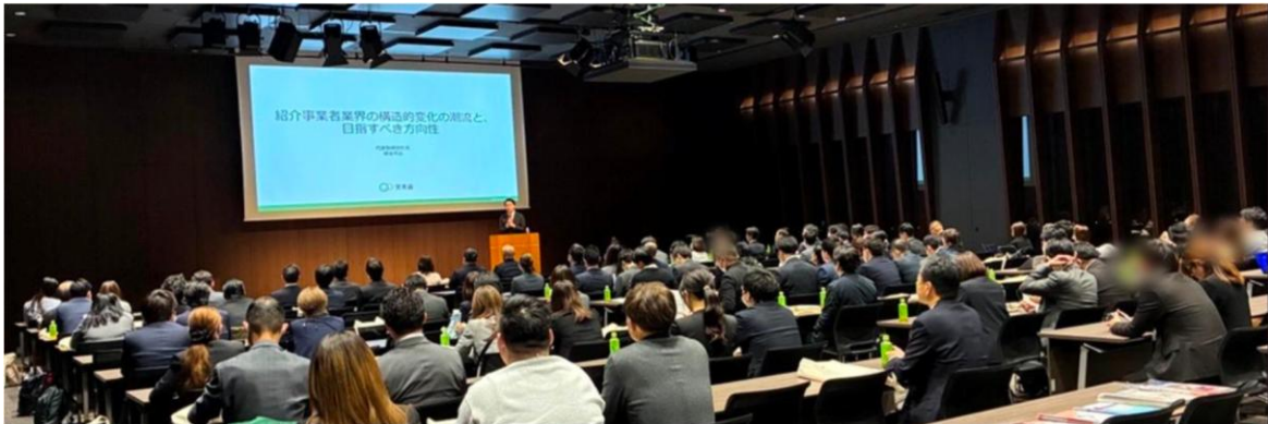
※前回の「笑美面 インパクトミーティング関東'26」(2 月 17 日開催)には、シニアホーム運営事業者の責任者など約 170 人が参加

*「ケアプライムコミュニティサイト」とは、サービスの質の向上を目指した全国のシニアホーム運営事業者に向けた情報提供の場です。2025 年 10 月末時点で 10,212 件のシニアホームが登録しています。